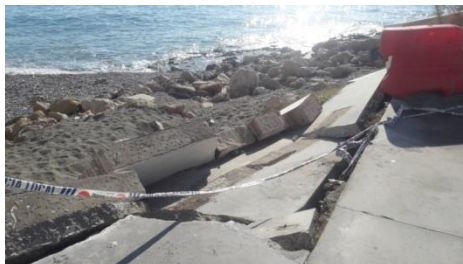
-Derrumbe en calle Escritora García de Fecieyri.