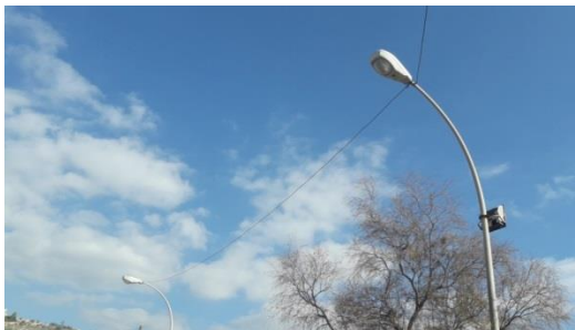
-Farolas con tendido eléctrico expuesto al aire.