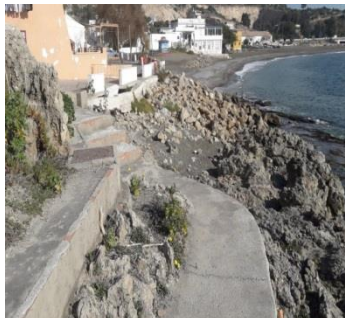
-Camino sin protección junto a las rocas en calle Escritora García de Fecieyri.