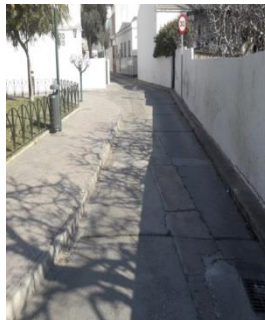
-Aspecto de aceras y asfaltado.

2.- Instar al equipo de gobierno a que el área de Movilidad realice un estudio urgente de los problemas de seguridad vial derivados del tráfico que afecta al barrio y de las dificultades que tienen que abordar los vecinos para pasar de una parte del vecindario a la otra, para que se lleven a cabo las medidas pertinentes que sirvan para mejorar el ordenamiento del tráfico de la barriada y la seguridad de los peatones, evaluando la posibilidad de construir una rotonda y afrontando, de acuerdo con las administraciones pertinentes, su posterior ejecución.”