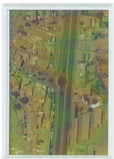
-Proyecto de la rotonda elaborado por los vecinos.