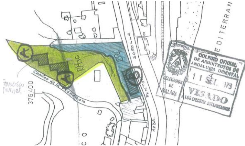
Imagen de los planos del proyecto. Zona RM-3C en verde y zona RP-4 en azul

En los datos de proyecto consta un volumen total de 10.592,46 m 3