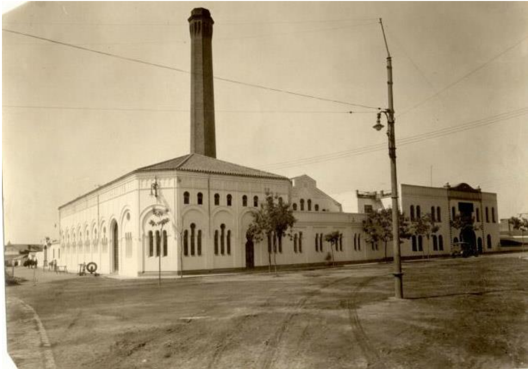
Fig. 1 Estado original de la fábrica, en la que se puede apreciar la parte construida por Eduardo Strachan en 1898 (a la izquierda) y la ampliación realizada por Juan Brotons en 1922 (a la derecha)