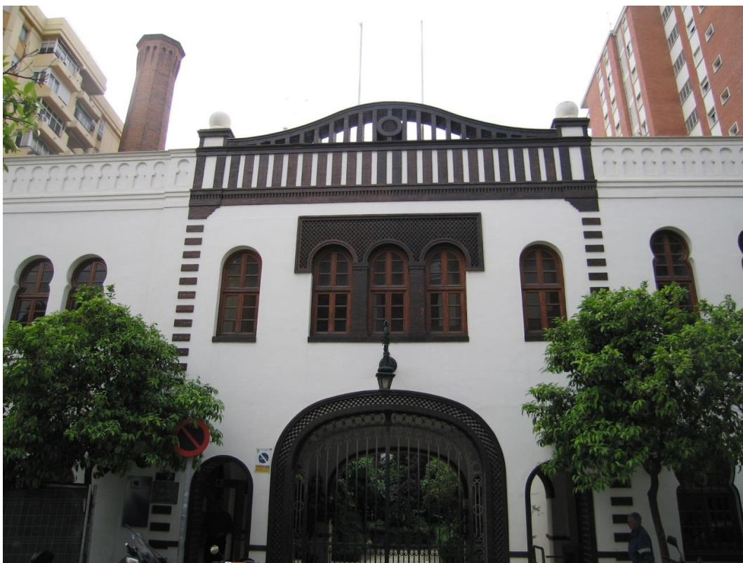
Fig. 3 Estado de la fachada y portada original de la fábrica tras la intervención de 1980

Por lo todo lo anterior y en atención a la petición de la Asociación en Defensa del Patrimonio Tecnológico y las Chimeneas Industriales de Málaga, proponemos la adopción de los siguientes