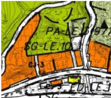
Imagen de la zona en el plano de calificación del PGOU-2011

De este análisis podemos realizar nuevas conclusiones a los efectos del volumen consumido, y son las siguientes: