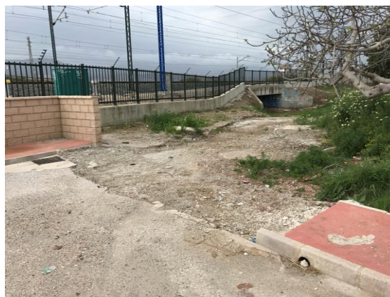
Vías del Ave y estado del acerado en la zona.