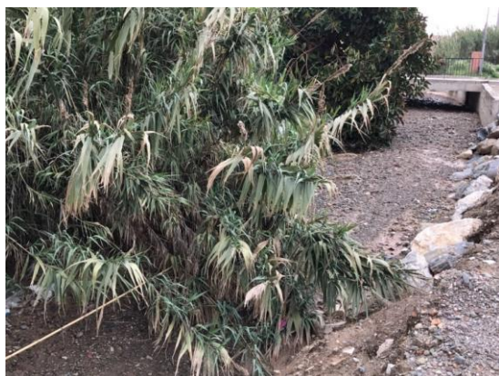
Encauzamiento inacabado y con vegetación salvaje.