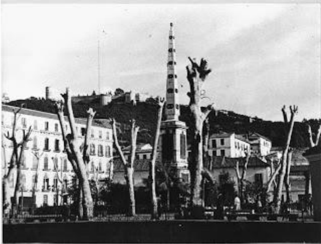
Antiguas viviendas sobre los restos del hospital de Santa que contaban con un bajo más una sola planta, se podía ver desde la propia plaza de la Merced tanto la Alcazaba como Gibralfaro