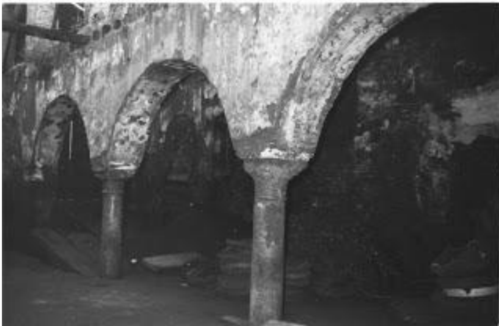
Restos de la capilla del Hospital, erigido en 1493, en las primeras décadas del siglo XX