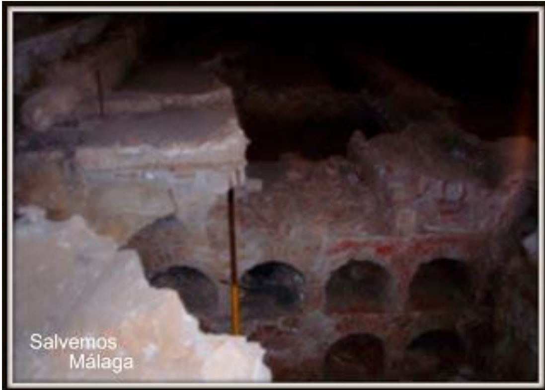
Restos de la cripta del antiguo Hospital de Santa Ana, erigido en 1493